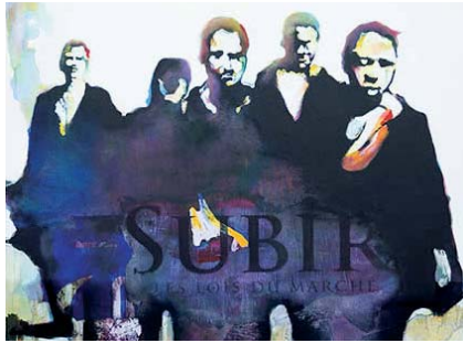
Bruce Clarke Subir (les lois du marché), détail, 2006

Que cachent les récentes gesticulations darcosiano-bessonnesques, en matière de travail caché et de travailleurs sans-papiers ? État des lieux.